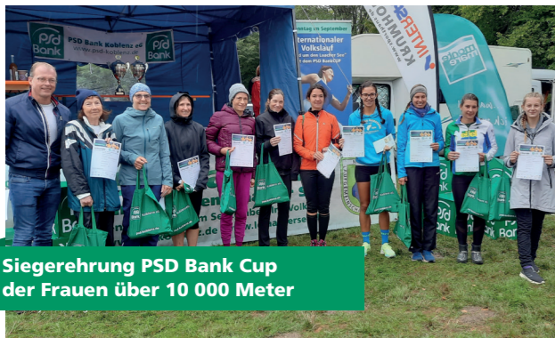
Siegerehrung PSD Bank Cup der Frauen über 10 000 Meter