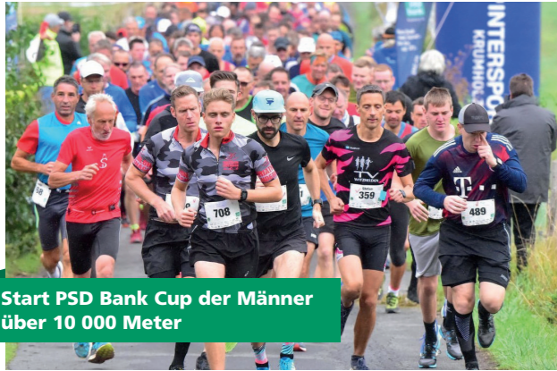
Start PSD Bank Cup der Männer über 10 000 Meter

Traditionell werden die Männer und Frauen getrennt auf die Strecke geschickt. So wird sichergestellt, dass es auf dem Rundkurs nicht zu eng wird.